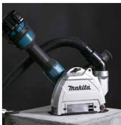
Colector de polvo