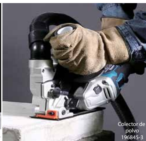
Colector de polvo 196845-3