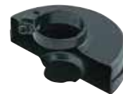
Protector de disco de corte.

100mm : 122909-7 115mm : 122910-2 125mm : 122911-0, 122905-5(up to 180mm)