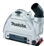
Colector de polvo. 115 - 125mm. 196845-3