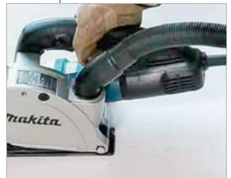
Conectable a un aspirador para mantener un ambiente limpio