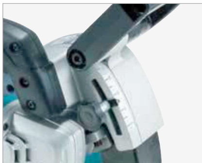
Ajuste de profundidad de corte