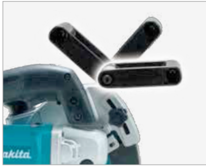
Cómoda empuñadura delantera ajustable en varias posiciones